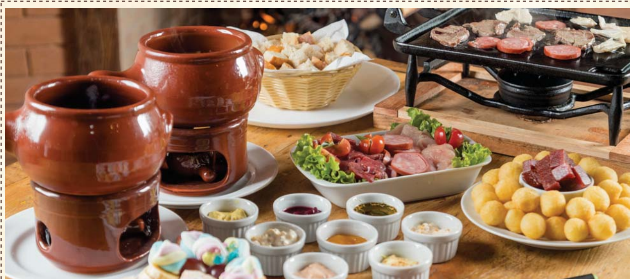
Rodízio de Fondue Tradicional à Vontade

Fondues de carne, queijo e chocolate tradicionais servidos à vontade.