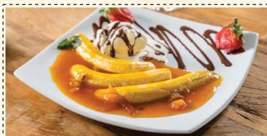
Banana Flambada com Sorvete de Creme

Suco de abacaxi, suco de laranja, creme de leite e Grenadine