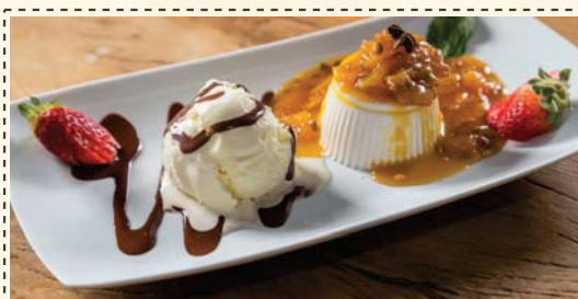
Bavaroise com Calda de Frutas Amarelas e Sorvete de Creme