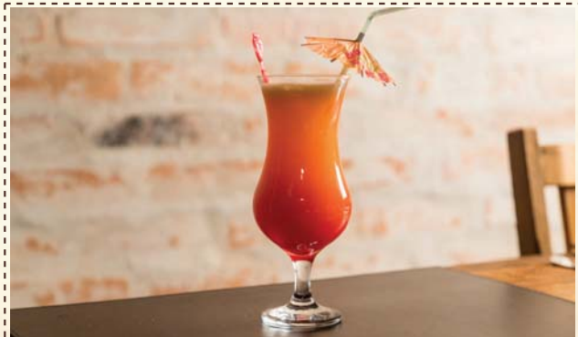
Sex On The Beach