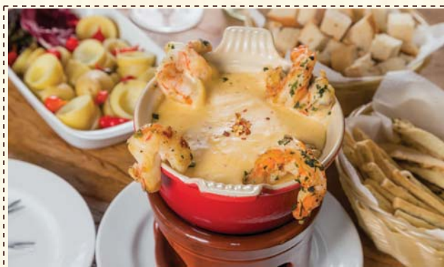
Fondue La Bella Colina Queijo com Camarão