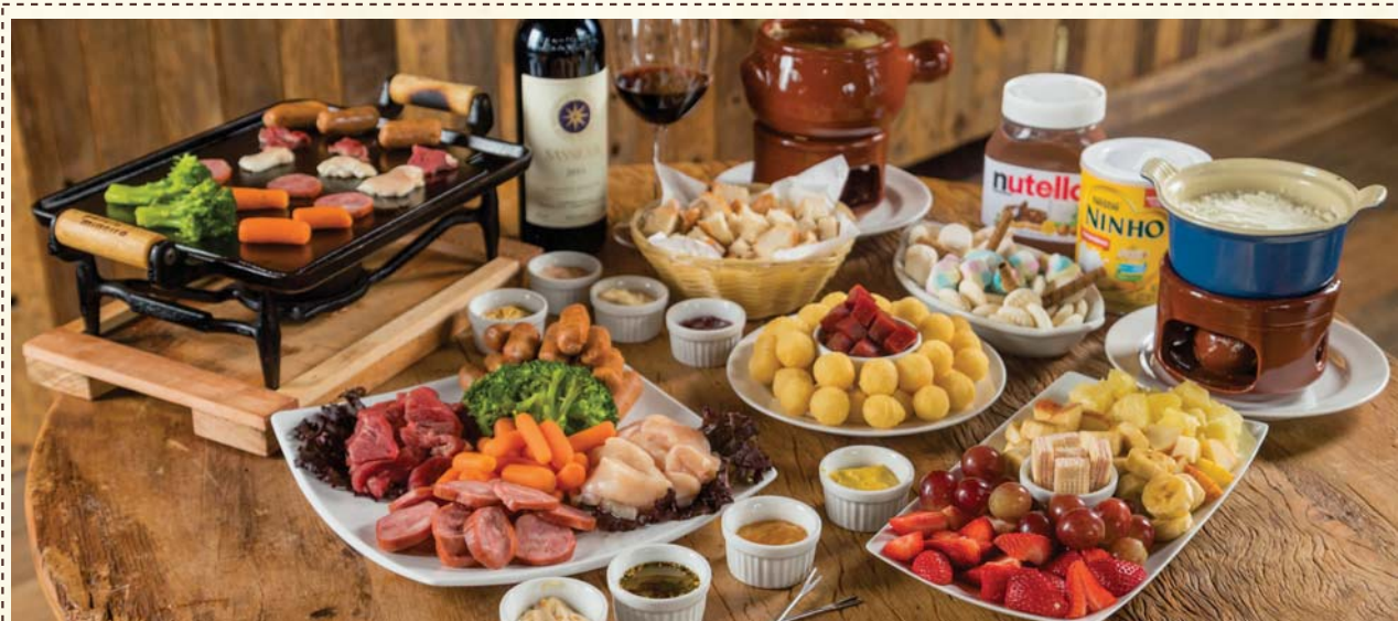
Rodízio Grill à La Collina com Fondue Branco Especial de Leite Ninho e Nutella

Fondue de Carne Grill à La Collina (descrito acima) + Fondue de Queijo + Fondue Branco Especial de Leite Ninho e Nutella acompanhado de frutas da estação, Marshmallow, mini biscoito wafer, mini suspiro e sequilhos.