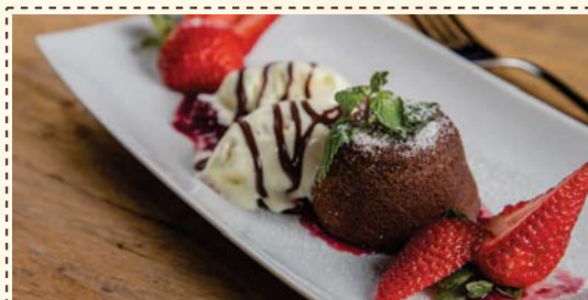
Petit Gateau com Sorvete de Creme